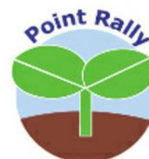
学びのポイントラリー

自治体や市民団体、NPO、大学、地域の施設、地元の民間企業等が実施する様々な教育プログラムを、民間団体がまとめて広報し、地域での学びの場への参加を促す取組が行われている（地域の学び推進機構 学びのポイントラリー 23 ）。登録プログラムは、市民生活、文化生活、職業生活、教科学習の補充・発展という4種からなり、児童生徒は参加すると時数に応じたポイントが得られる。さらに、一定のポイントまで達するごとに参加を証明する「認定証」の発行を機構から受けることができる。教育プログラムが一覧化されて機構のホームページや学校を通じて広報されることにより、児童生徒は、興味関心に応じて幅広いプログラムから選びやすくなる。教育委員会等の後援も受けながら、平成30年3月現在、全国11の地域で実施されている。