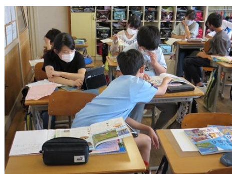
(単元内自由進度学習)