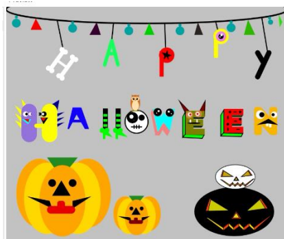
作成したプロトタイプ