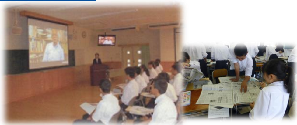
④の様子：スタンフォード大学遠隔講義