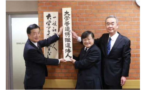
【大学等連携推進法人の認定】