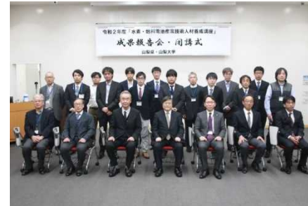
【「水素・燃料電池産業技術人材養成講座」成果報告会・閉講式】

・ 山梨県と連携し、県内産業界の社会人技術者のリカレント教育の一環として、「水素・燃料電池産業技術人材養成講座」（修了者19名）及び「医療機器産業技術人材養成講座」（修了者19名）を開講した。 各講座ではグループごとに研究発表会を開催し、実用化に向けた議論を行った。