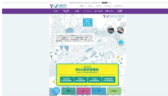
【Web オープンキャンパス】