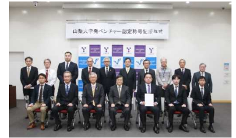
【ベンチャー認定称号記号授与式】