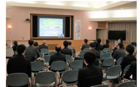
【「医療機器産業技術人材養成講座」特別講義の様子】

・社会連携課、社会連携・知財管理センターを中心に産学官連携支援体制の強化や、自治体等との連携協議の場の充実・強化に引き続き取り組んだ結果、地域（山梨・静岡・長野）の要請に応える共同研究、学術指導契約等の件数は、平成26年度実績の38件を大幅に上回る69件（共同研究契約59件、学術指導契約7件、受託研究契約3件）を達成した。