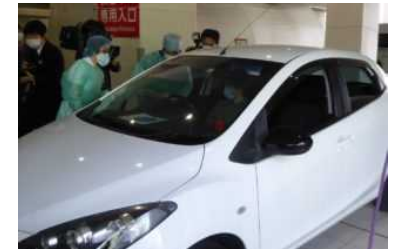
【ドライブスルーPCR検査シミュレーションの様子】