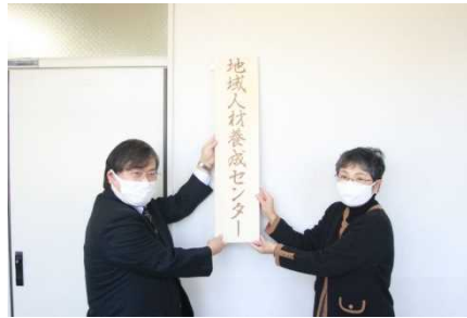
【地域人材養成センターの設立】

・山梨県立大学とのガバナンス連携の取組をさらに加速させるため、 文部科学省「国立大学経営改革促進事業」の採択（令和2年11月）を機に、「地域人材養成センター」を新設して、人材養成に関する地域・大学連携の取組を強化するなど、学長のリーダーシップに基づくスピード感のある経営改革及び国立大学のモデルとなり得る先進的な事業を展開した。【52-2】