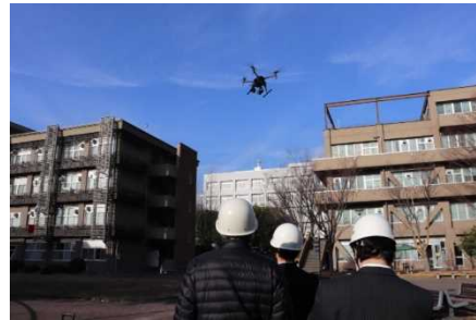
【災害時に向けたドローン訓練】