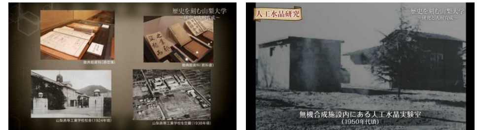
【動画「歴史を刻む山梨大学」】