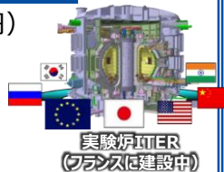
実験炉ITER(フランスに建設中)