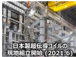
日本製超伝導コイルの現地組立開始(2021.6)