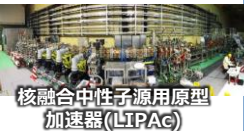
核融合中性子源用原型加速器(LIPAc)