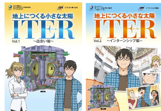
ITER計画を紹介するコミック