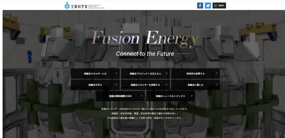
文部科学省の核融合HPのトップページ

( https://www.mext.go.jp/a_menu/shinkou/fusion/ )