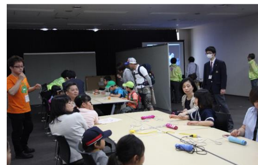
Fusionフェスタの実験教室