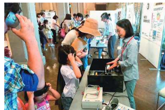
核融合とレーザーの実験教室