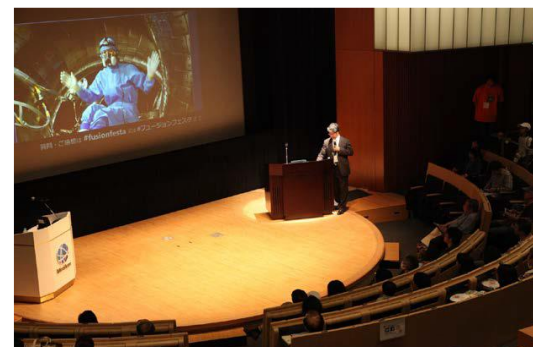
Fusionフェスタのライブ中継