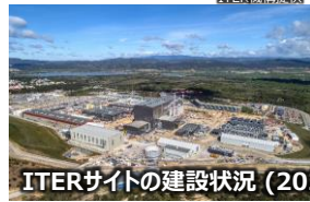
ITERサイトの建設状況(2021.5)