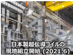
日本製超伝導コイルの現地組立開始(2021.6)