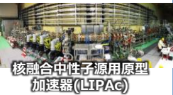
核融合中性子源用原型加速器(LIPIAc)