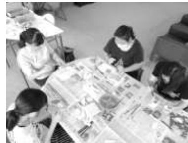
図 3-9 工作活動の様子

令和 2 年度登録生 12 人のうち、3 人 (中学生) は令和 3 年 4 月から通常どおり所属校へ通う意思を示しており、年度末の振り返りでは「学習計画を自分で立てたり、好きな活動に取り組んだりすることで、少しずつ自信をつけることができた」や「最初はとても不安だったけれど、ここでは多くの先生方が優しく接してくれたので、人と話すことに慣れることができた」等の感想が寄せられた。