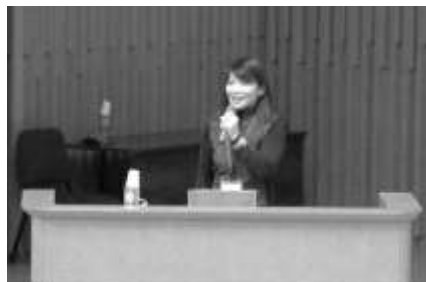
図 6-1 特別講演の様子