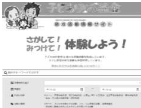
図 8-1 子どもゆめ基金助成金活動情報サイト

助成活動の事例と申請時のポイントをまとめた「子どもゆめ基金ガイド」を作成し、全国の関係機関等へ配布するとともに、ホームページに掲載し広く情報提供を行った。