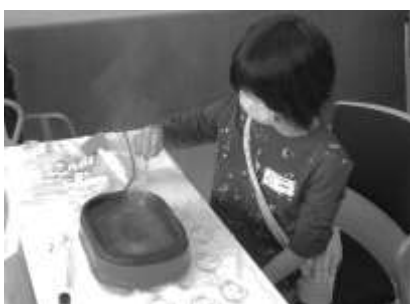
図 3-4 体験ブースの様子