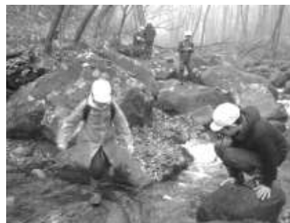
図 5-1 沢歩きハイキングでの様子

また、令和2年度は、西郷村教育委員会の協力により、西郷村小学校校長会の研修会において、セカンドスクール及び教科等に関連付けた体験活動プログラムをテーマとして話し合われた結果、教科等に関連付けた体験活動プログラムの共通カリキュラムとして前述した理科の学習「流れる水のはたらき」と関連付けた「沢歩きハイキング」及び社会科の学習「私たちの生活と森林」と関連付けた「森の恵みの体験学習（紙すき体験）」を行うことが決定するなど、教科等に関連付けた体験活動プログラム事業が広がっている。