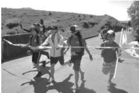
図 3-6 100km ゴールの様子

阿蘇では、阿蘇山や外輪山など計 100km の道のりを歩く 6 泊 7 日の長期キャンプを実施した。この事業は平成 29 年度から 1 泊ずつ日数を延ばして実施しており、これまではサイクリングを含めカルデラ内を一周する行程だったが、令和 2 年度は 6 泊となったことで、「大観峰」「二重峠の石田畳」「草千里」等の阿蘇の自然や歴史をより感じ