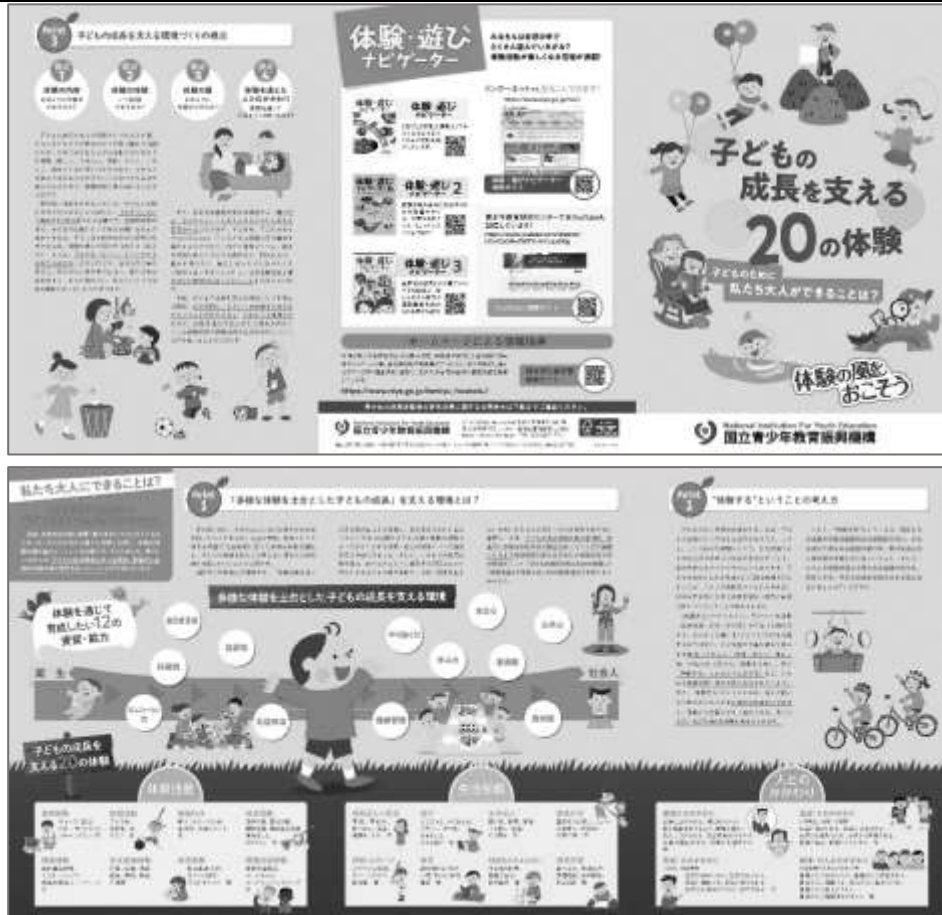
図 7-1 「子どもの成長を支える 20 の体験」リーフレット