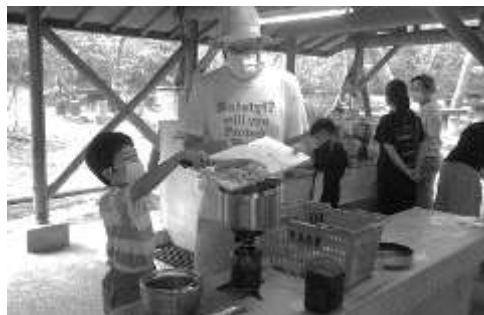
図 3-1 親子で野外調理の様子

吉備では、親子で屋外にてハイキングや樹木ビンゴ、おもしろ自転車、野外調理（図 3-1 参照）等を楽しむ施設開放型の事業を行ったり、夏休みに家族で出かける機会の一つとして2泊3日でキャンプを実施したりした。参加者からは「ゴールデンウィークはあまり外で遊べなかったから、疲れたけど楽しかった」、「久しぶりに外で遊べた。家にいるよりも楽しかった」等の感想が寄せられた。