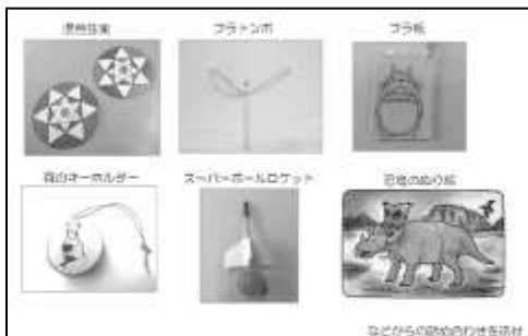
図 3-2 工作キット（完成版）

また、岩手山では日本紙飛行機協会・岩手県立博物館・盛岡市子ども科学館と連携し、家で過ごす時間が長くなっている全国の子供たちに工作キットを提供した。全国各地に紙飛行機や恐竜塗絵、混色こま等が入った工作キット（図 3-2 参照）を4,490セット送った。工作キットを受け取った子供や保護者からは、「4月から小学校休校、学童休止、保育園休園となり、外出自粛をしております。近所の公園には規制テープが貼られ、公園遊びも自粛となり、公園遊びもできていない状況です。自然に触れることが減ってしまった娘達に、創作キットでおうち時間を楽しんでもらえる機会を作ってください、本当にありがとうございます」等の感想が寄せられた。