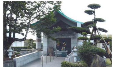
星塚敬愛園の納骨堂

高齢や後遺症、周囲の偏見などを乗り越えて、療養所を退所して社会復帰した人もいますが、その数は決して多いとはいえません。療養所に入所したときに、家族に迷惑が及ぶことを心配して本名や戸籍を捨てた人もいるため、現在も故郷に帰ることなく、肉親との再会が果たせない人もいます。療養所で亡くなった人の遺骨の多くが実家のお墓に入れず、各療養所内の納骨堂に納められています。