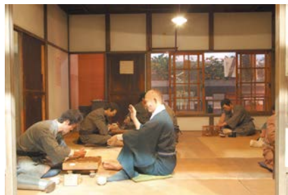
昔の療養所の暮らしが再現されています

〒189-0002 東京都東村山市青葉町4-1-13 電話 042-396-2909 URL http://www.hansen-dis.jp/