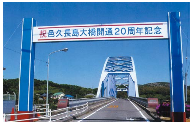
人間回復の橋と呼ばれる邑久長島大橋

長島と対岸の虫明を結ぶ邑久長島大橋は、1988年(昭和63年)に開通しました。隔離する必要のない証、人間回復の証として架橋され、現在は民間バスも乗り入れ、入所者も自由に島外に出かけられるようになっています。