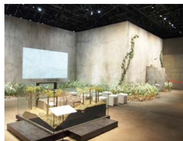
縮尺1/20の模型(手前)と実寸大で部分再現された重監房

〒377-1711 群馬県吾妻郡草津町草津白根464-1533 電話 0279-88-1550 URL http://sjpm.hansen-dis.jp/