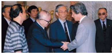
控訴断念するかどうかの最終判断をする直前に、ハンセン病訴訟原告代表と面談する小泉内閣総理大臣(当時)

熊本地裁の判決に対し、国は控訴※断念を決めるとともに、内閣総理大臣談話を発表し、ハンセン病問題の早期解決に取り組む決意を表明しました。しかし判決後も、熊本県で入所者に対するホテル宿泊拒否事件が起き、これが報道されると、今度は元患者に対する誹謗中傷が行われる事態に発展するなど、残念ながら入所者や社会復帰者、その家族に対する偏見や差別には根強いものがあります。そのため、療養所の外で暮らすことに不安を感じ、安心して退所することができないという人もいます。