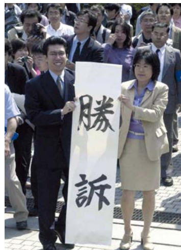
熊本地裁での勝訴発表

熊本地裁判決の日に 原告が勝訴の感動を綴った詩 太陽は輝いた 90年、長い長い暗闇の中 一筋の光が走った 鮮烈となって 硬い殻を砕き 光が走った 私はうつむかないでいい みんなと光の中を 胸を張って歩ける もう私はうつむかないでいい 太陽は輝いた