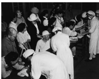
治療薬「プロミン」の注射

ハンセン病患者の隔離政策は、「癩予防法」という法律のもとで進められました。昭和28年（1953年）、患者の反対を押し切ってこの法律を引きつぐ「らい予防法」が成立しました。この法律の問題点は、患者隔離が継続され、退所規定が設けられていないことでした。つまり、ハンセン病患者は療養所に収容されると、一生そこから出ることが出来なかったのです。昭和21年にハンセン病の特効薬「プロミン」が登場し、その後、新しい飲み薬タイプの治療薬が開発され、ハンセン病は適切な治療をすれば治る病気になっていました。にもかかわらず、患者の強制収容が続けられたのです。昭和30年前後から徐々に規制が緩和され、病気が治って自主的に退所する人たちも出てきました。しかし彼らは療養所に入所する際に、社会や家族と断絶させられており、療養所の外では頼る人はなく、救いの手を差し伸べる人も、受け皿もなかったのです。そのような状況の中で、生活苦で体を壊したり、病気を再発させたりして、やむなく療養所に戻る人も少なくありませんでした。