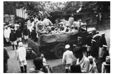
患者の収容には警察官が立ち会った

19世紀後半、ハンセン病はコレラやペストなどと同じような恐ろしい伝染病であると考えられていました。当初は、家を出て各地を放浪する患者が施設に収容されましたが、やがて自宅で療養する患者も収容されるようになりました。ハンセン病と診断されると、市町村や療養所の職員、医師らが警察官を伴ってたびたび患者のもとを訪れました。そのうち近所に知られるようになり、家族も偏見や差別の対象にされることがあったため、患者は自ら療養所に行くしかない状況に追い込まれていったのです。このような状況のもとで、昭和6年(1931年)にすべての患者の隔離を目指した「癩予防法」が成立し、療養所の増床が行われ、各地にも新しく療養所が建設されていきました。また、各県では「無癩県運動」という名のもとに、患者を見つけ出し療養所に送り込む施策が行われました。保健所の職員が患者の自宅を徹底的に消毒し、人里離れた場所に作られた療養所に送られていくという光景が、人々の心の中にハンセン病は恐ろしいというイメージを植え付け、それが偏見や差別を助長していったのです。