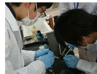
五国SSH連携プログラム