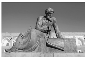
アル・フワリズミ

2次方程式の解法は、アラビアの数学者アル・フワリズミ(780頃-850頃)が示している。彼は、最古の代数学の書を著したことで有名である。ちなみに、計算の規則を意味する言葉「アルゴリズム」は彼の名前が語源となっている。