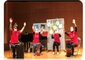
配信した動画の一場面