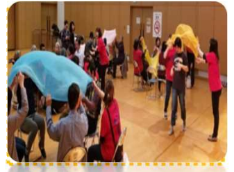
超参加型音楽会の様子♪

MLAPの動画です♪みんなで楽しんでください♪感想は是非 hogsha@fiku.jp へ♪