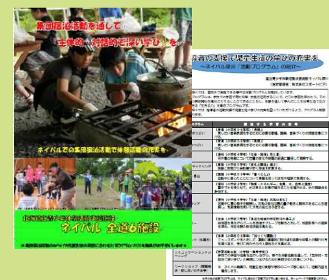
学校向けリーフレットとプログラム集