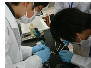
五国SSH連携プログラム