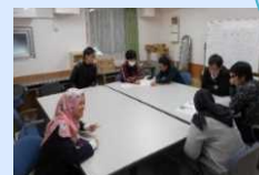
国際寮における日常的な国際交流