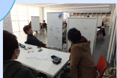
学生同士のアクティブ・ラーニング