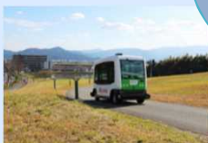
構内道路を活用した実証実験