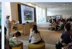
地域への公開講座

ポストコロナ社会におけるオンラインと対面の 双方のメリット をいかした 効果的なハイブリッド にも対応