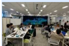
他大学や企業等とのオープン・ラボ