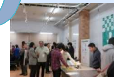
地元企業との交流会