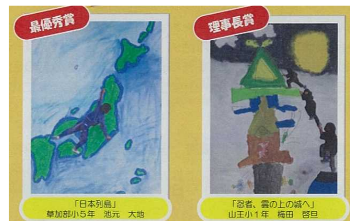
図 5-1 クライミングアートコンクール作品

令和元年度は、全国の小学生を対象に、仕上げた作品を表彰する「クライミングアートコンクール」を各施設の協力を得て実施した。その結果、全国から 314 人から応募があり、乗鞍を利用した小学生が描いた「忍者、雲の上の城へ」が理事長賞を受賞した。