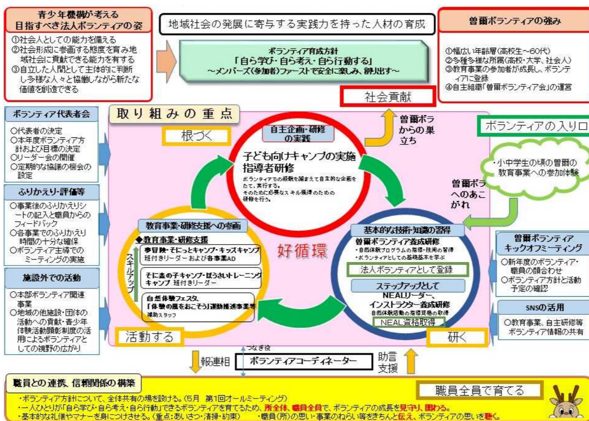
図 4-1 曾爾青少年自然の家 ボランティア育成ビジョン

本事業を通して、ボランティア像や中長期的な取組みが初めてボランティアと共有された施設も多く、「ボランティア育成ビジョン」を改善するための良い機会となった。