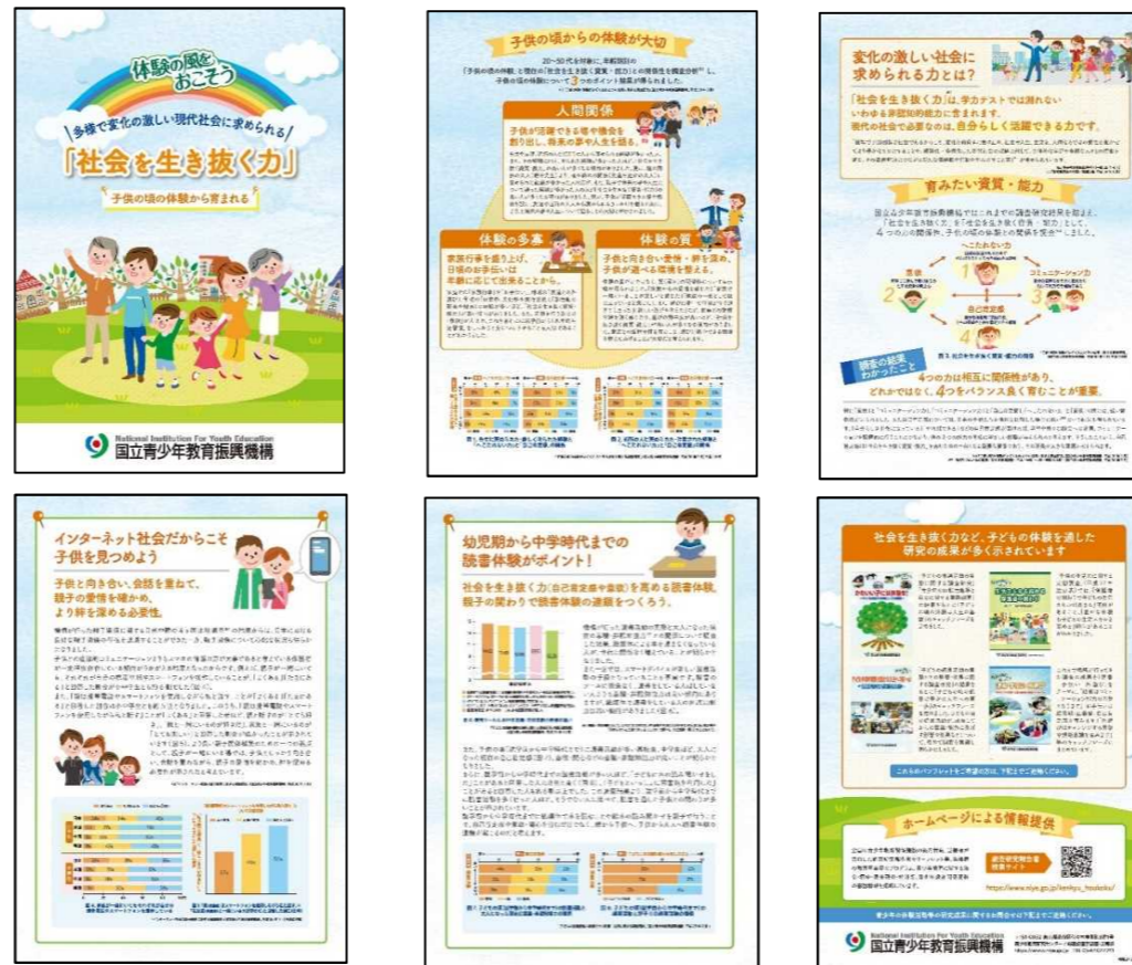
図7-2 【「社会を生き抜く力（パンフレット）」改訂版】

令和元年度では、平成30年度に作成した「社会を生き抜く力」を構成する4つの資質・能力（へこたれない力・意欲・コミュニケーション力・自己肯定感）をテーマにしたパンフレットに、新たに「子どもの読書活動の実態とその影響・効果に関する調査研究」と「子供の頃の読書活動の効果に関する調査研究（速報版）」の調査結果を加え、読書活動の大切さや親子での読書活動のつながりについての内容を改定し、機構ホームページに掲載するとともに各教育施設を通じて青少年団体等への普及を図った（図7-2）。