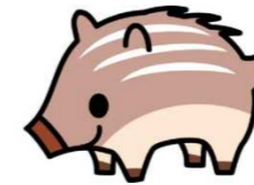
吉備のキャラクター 「ウーリー」

ミニボラの子供たちは、ミニボラの証である「ミニボラビブス（黄色）」を着ながら、ボランティアのお手伝いを行った。黄色のビブスは、吉備のボランティア・ユニフォームと同じ色のため、幼児たちにも良い影響を与え、「自分も早くビブスが着たい」「あの黄色い服はどうしたら着られるの？」と幼児たちにとってあこがれのビブスとなり、子供たちのやる気を後押しすることができた。