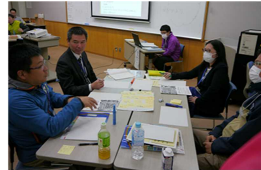
図 6-1 分科会の様子