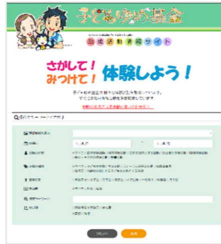
図 8-1【子どもゆめ基金助成金活動情報サイト】

助成活動の事例と申請時のポイントをまとめた「子どもゆめ基金ガイド」を作成し、全国の関係機 関等へ配布するとともに、ホームページに掲載し広 く情報提供を行った。