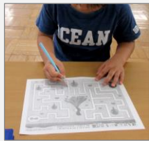
図2 点つなぎに取り組む