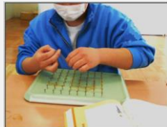
図3 ジオボードを用いた漢字の形作り