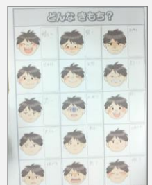
図2 表情と気持ちの関係