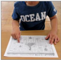
図1 迷路に取り組む