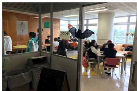
相模向陽館高校(昼間)定時制での「ひまわりカフェ」