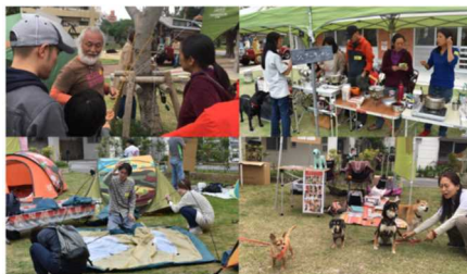
行政機関はもちろん、防災の専門家やキャンパー、ペットコミュニティなどと連携、協働実施。