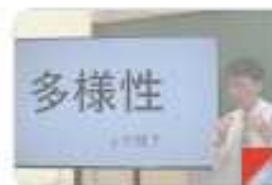
2_ぼくはイエローでホワイト... 動画