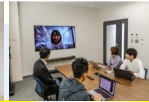
ICTによる コミュニケーション