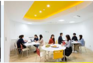
食堂での ランチミーティング