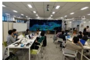
他大学や企業等との オープン・ラボ