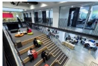
研究室の枠を越えた コラボレーションを生み出す オープンスペース