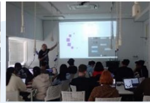
文理融合した 新たな教育