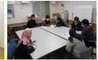
国際寮における 日常的な国際交流