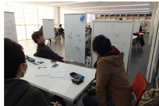
学生同士の アクティブ・ラーニング

⇒ 多様な学生・研究者や異なる研究分野の「共創」、地域・産業界との「共創」の促進等により、教育研究の高度化・多様化・国際化、地方創生や新事業・新産業の創出に貢献