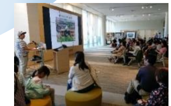
地域への公開講座