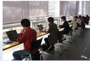
集中して学修 できるスペース