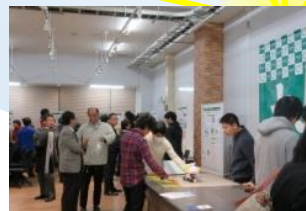
地元企業との交流会