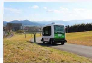
構内道路を活用した実証実験