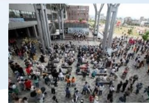
地域に開かれたキャンパス