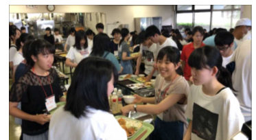
食事の配膳も自分たちで