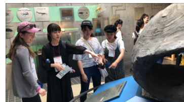
美波町 うみがめ博物館