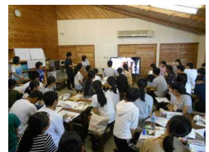
県南の魅カプレゼン