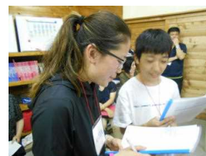
海外大学生とペアワーク