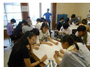
少人数グループ学習②