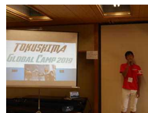
個人プレゼンテーション

牟岐町におけるあんどんの文化的意味や歴史について地元中学生が英語で説明した動画を視聴した後, 5人程度の班で活動。「牟岐あんどんの会娃娃哩(あかり)」のメンバーの指導の下, 各自半紙に絵や文字をかき, 木製の骨組みを組み立て半紙を貼って完成。