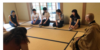
坐禅の後に茶道体験も