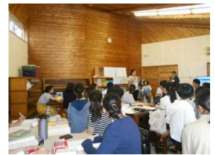
海外大学生のプレゼン