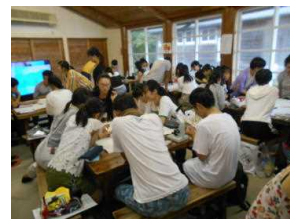
少人数グループ学習①

Evening Sessionの講師希望調査と調整, 夜のつどいについて相談, 自学自習