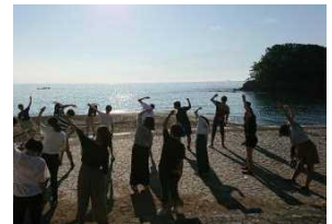
海岸でラジオ体操