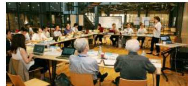
チャレンジラボ：扇が丘キャンパス