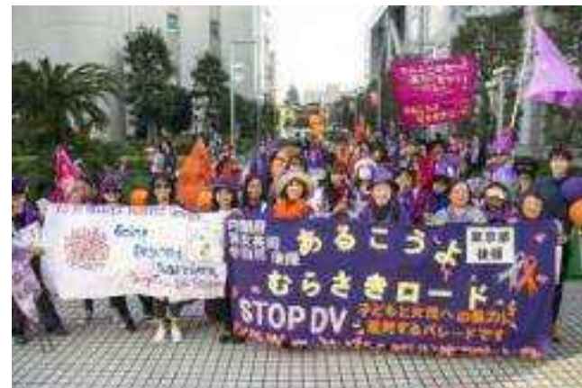
▼市民団体による女性支援活動への助成金

透明性と説明責任 : 生産者と消費者が産地で生産状況を確認する「公開確認会」を実施、定期的な情報発信。