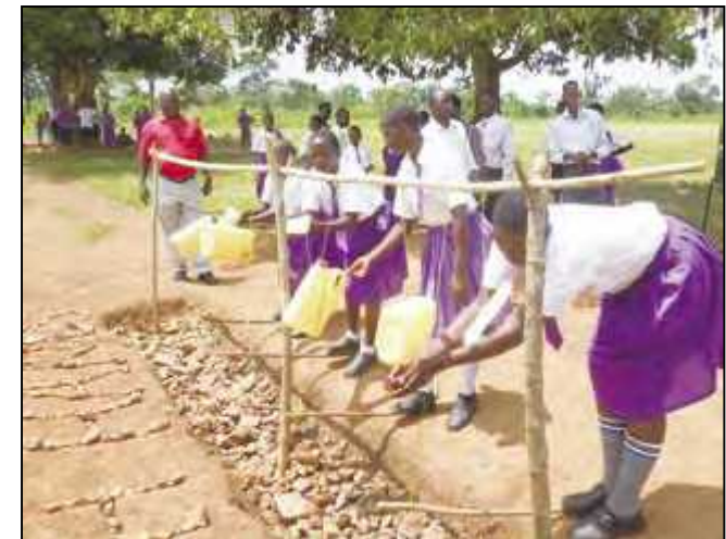
▼簡易手洗い装置(ウガンダの学校)

透明性と説明責任: ウガンダやボルネオでの取組をサラヤの持続可能性レポート等で随時更新、公開。