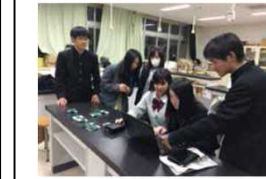
(福島県立福島高等学校)