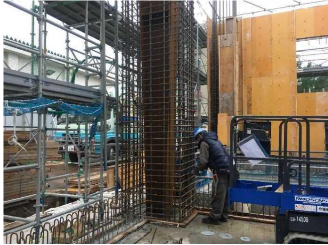
鉄筋工事施工状況