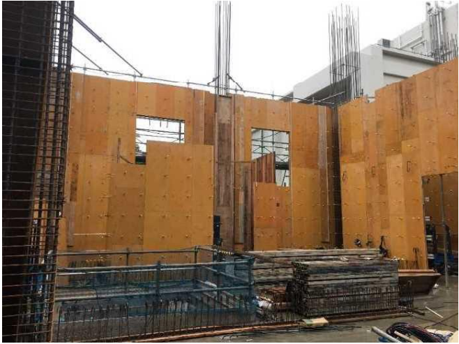
型枠工事施工状況