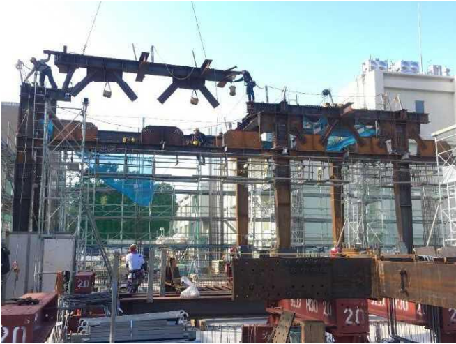
鉄骨工事施工状況