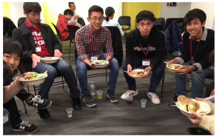
↑ GEM=Global Empowerment Mindset session in Boston

This original program started in 2014. We train prior to going to New York and Boston in late March. This annual program is aimed at learning about leadership.