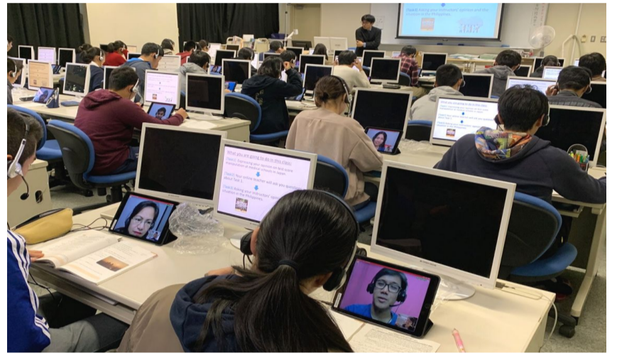
↑ Online lessons are facilitated using tablets.

All of Global 10 schools have this program. However, ours is different from others'. We have original worksheets which our English teachers make addressing current controversial topics. That enables us to think carefully about the problems we are facing now.