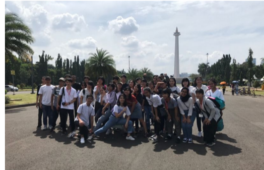
↑ We were paired up with Indonesian students and visited several famous spots in Jakarta. ←As a part of our presentation to introduce Japan, we performed Soranbushi, a traditional dance.