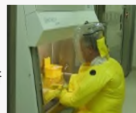
安全キャビネット内でのウイルスを用いた作業

「感染症研究国際展開戦略プログラム」では、9大学が海外研究拠点で、各地で流行したウイルスの遺伝子解析を行うなどの基礎研究を行っている。新型コロナウイルス感染症についても、検体の収集・分析、迅速診断技術の確立等、予防・診断・治療法の研究開発が行われている。