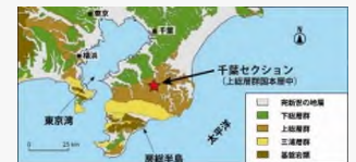
千葉セクションの位置

千葉県市原市の養老川河岸に露出する地層断面「千葉セクション」が、地球上の磁場逆転を最も分かりやすく示していたことなどから、中期更新世 (77.4万年前~12.9万年前) の地質時代の名称として「チバニアン」と命名された。