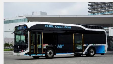
水素社会の構築に向けた環境・エネルギー技術

本章では、未来社会に向けた政府の取組について紹介する。政府においては、AIやIoTなど科学技術・イノベーションの急速な進展により、人間や社会の在り方と科学技術・イノベーションとの関係が密接不可分となっている現状を踏まえ、人文科学を含む科学技術の振興とイノベーション創出の振興を一体的に図っていくための「科学技術基本法等の一部を改正する法律案」を第201回通常国会に提出している。また、現在、令和3年度からの次期科学技術基本計画の策定に向けた議論も行われている。また、政府の取組として未来社会のビジョンを設定し、それに向かって研究開発を行うプログラムであるムーンショット型研究開発制度や、ビジョン主導型のチャレンジング・ハイリスクな研究開発を支援するプログラムであるセンター・オブ・イノベーションプログラム、来館者と研究者が未来の社会像について共に考える活動を推進している日本科学未来館の取組、未来社会の実験場として期待される2025年日本国際博覧会 (大阪・関西万博)、IoT、ビッグデータ等の先進的技術の活用により都市・地域の課題の解決を図るスマートシティの取組を紹介している。さらに、東京2020大会も契機に研究開発を進めてきた科学技術による課題解決に向けた具体的な研究開発の取組として、水素社会の構築に向けた環境・エネルギー技術等を紹介している。