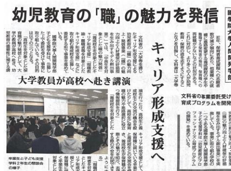
日本教育新聞（令和5年12月4日）