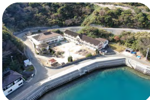
由良小学校須下分校 平成5年1月竣工 平成24年3月廃校

【所 在】愛媛県宇和島市津島町須下181番地 【校 舎】鉄筋コンクリート造 2階 1,016㎡ 【屋内運動場】鉄筋コンクリート造 1階 596㎡