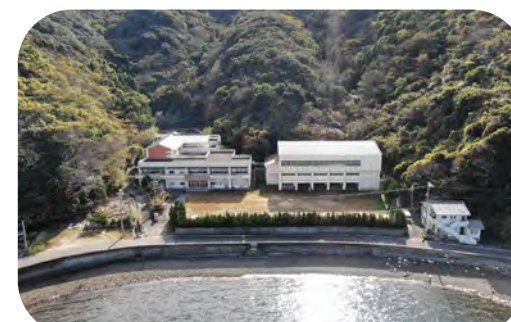
由良小学校平井分校 平成7年2月竣工 平成24年3月廃校

【所 在】愛媛県宇和島市津島町平井336番地 【校 舎】鉄筋コンクリート造 3階 1,114㎡ 【屋内運動場】鉄筋コンクリート造 2階 633㎡