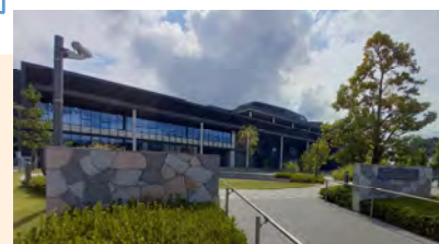
芸術文化観光専門職大学