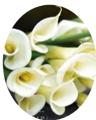
生産量全国1位 水生カラー