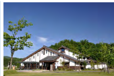
コウノトリ文化館