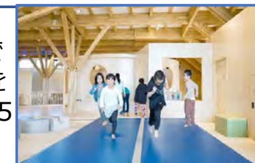
R5.5 オープン 子ども室内遊戯施設「はれっぱ」

札幌や新千歳空港から車で45分。子育て世代の移住を促す環境整備により、令和5年人口増加率全国1位。