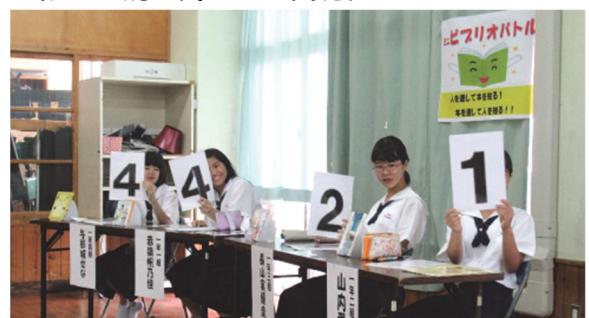
読書月間イベント「ミニブリオバトル」