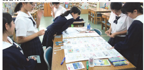
読書旬間イベント「ポップコンテスト」