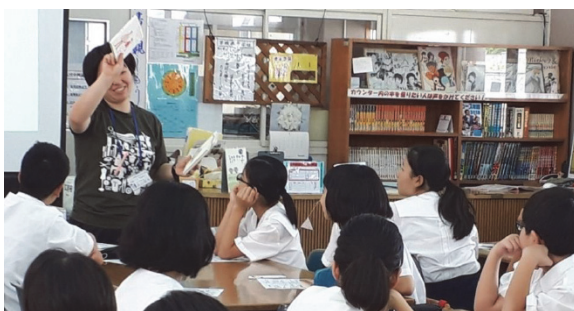
全学年図書館オリエンテーション