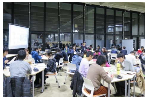
図書館での講義（週2～3日の利用がある） （グループディスカッション）