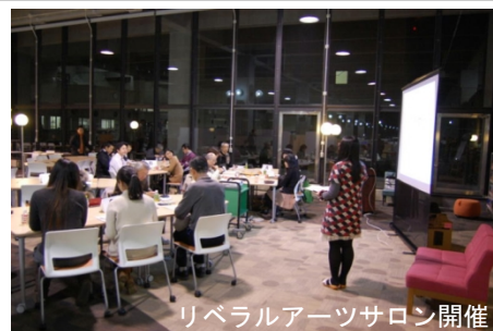
リベラルアーツサロン開催

大学名：東北大学 建物名：附属図書館 本館 工期：平成25年10月～平成26年9月 構造・階数：RC・地上2階、地下2階 延床面積：12,481㎡ 事業費（設計費含む）：1,441,260千円