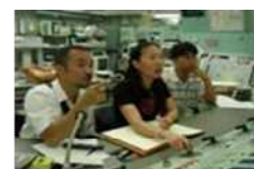
施設・設備の共同利用の促進

機関が所有する原子力施設等を、学外へ共有することにより、他大学へ実験・実習の機会を提供。例えば京都大学では、京都大学臨界集合体実験装置(KUCA)での炉物理実験教育の実施により、全国大学から毎年度180名程度の学生を受け入れ、実験教育を通じた人材育成を実施している（平成26年度以降は、施設の新規制基準適合性に係る審査のため停止中であるが、施設の運転を伴わない形での実験教育を実施している）。