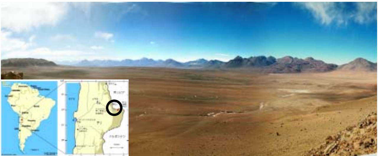
写真: 建設予定地である南米アンデス山脈中の高地(約 5,000m)