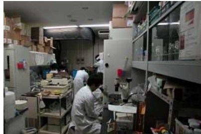
機能性の低い実験室(新たな研究の展開が困難)