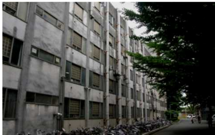
外壁・建具落下の危険