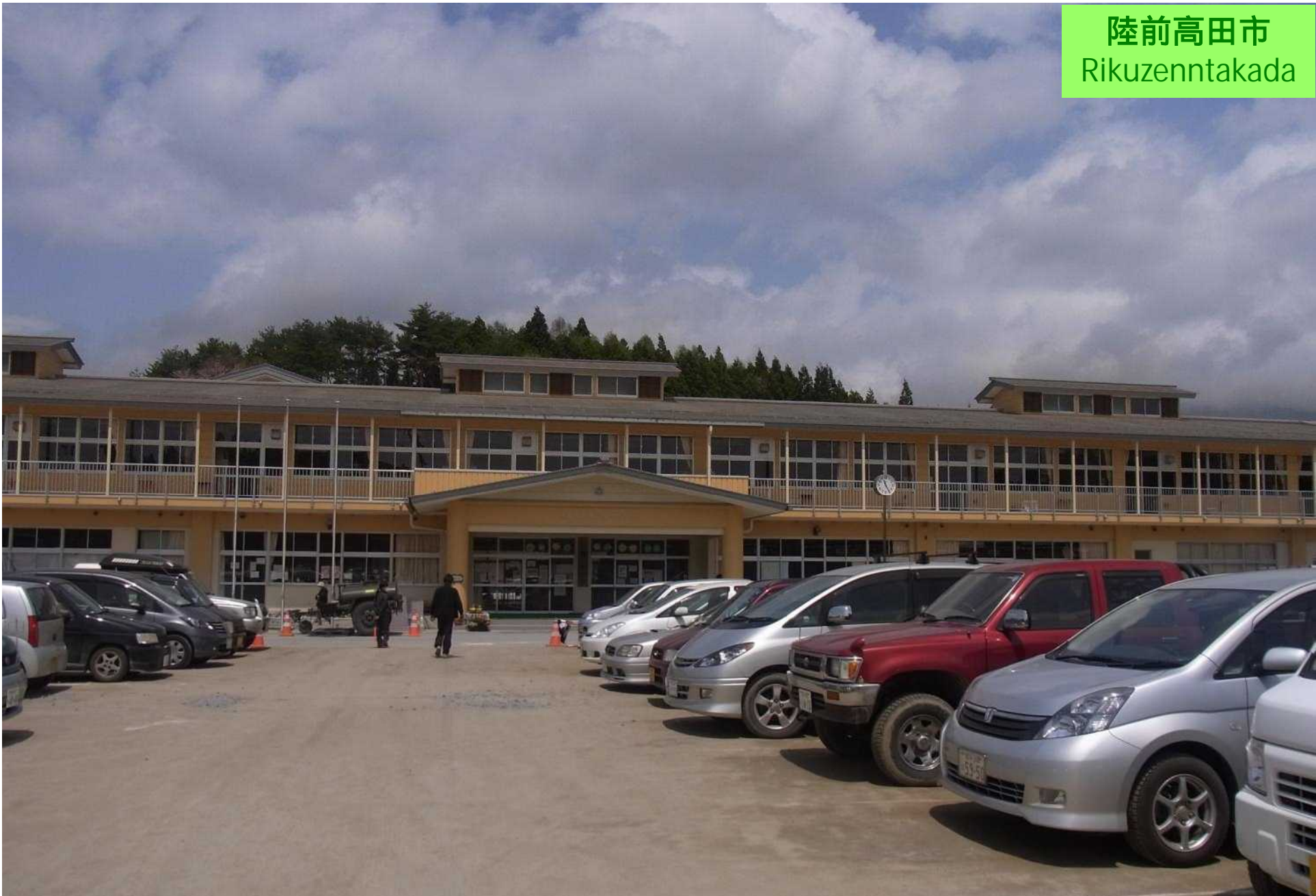
避難所となった市立第一中学校 Secondary school as the shelter for the refugees