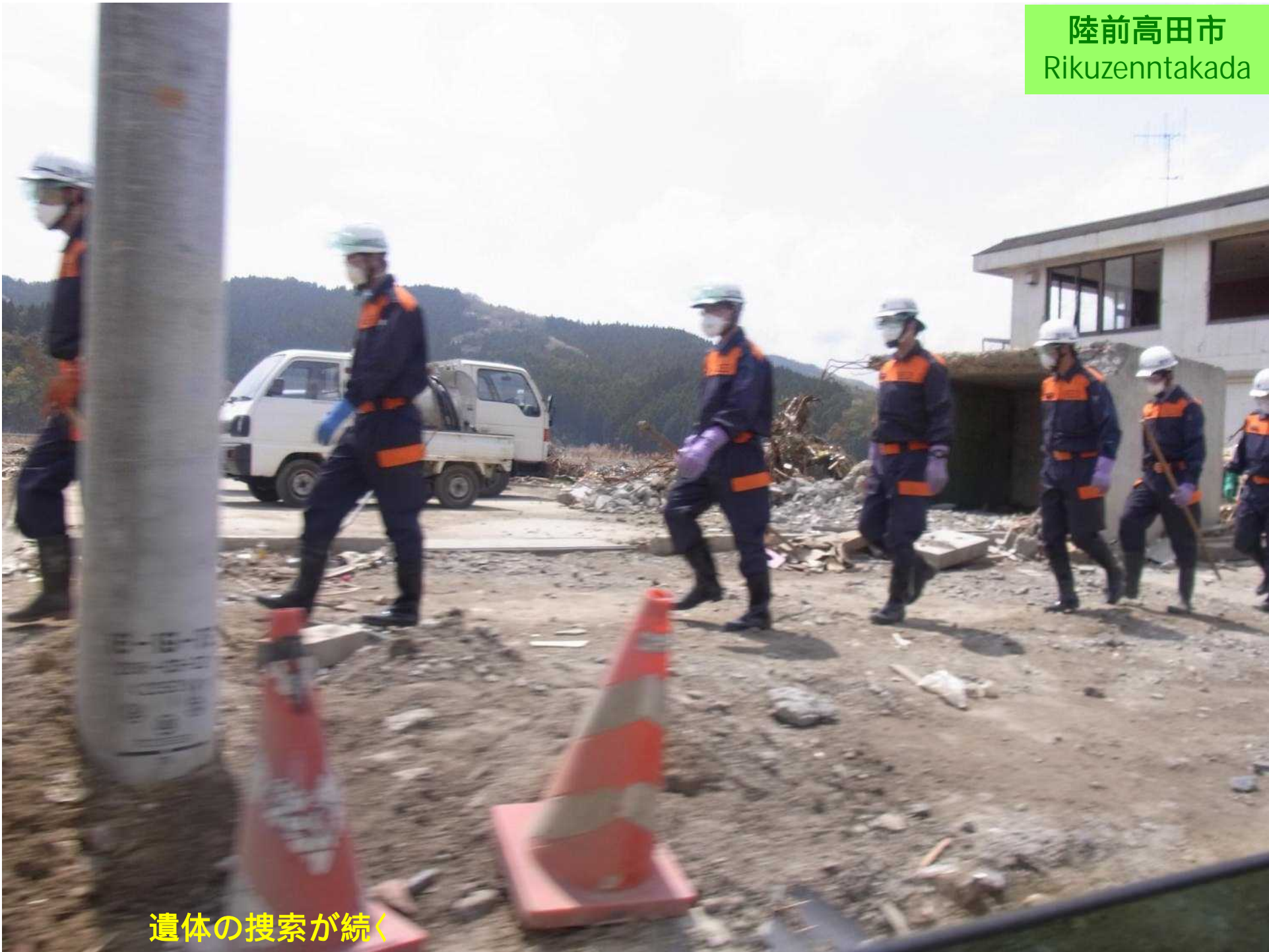
遺体の搜索が続く