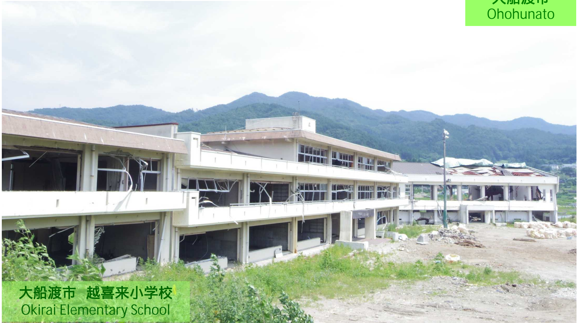
大船渡市 越喜来小学校 Okirai Elementary School