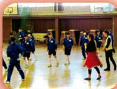
外部指導者によるダンス指導