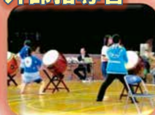
外部指導者による和太鼓指導