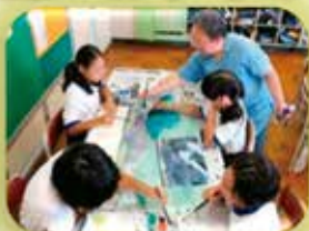
学習支援ボランティアによる指導