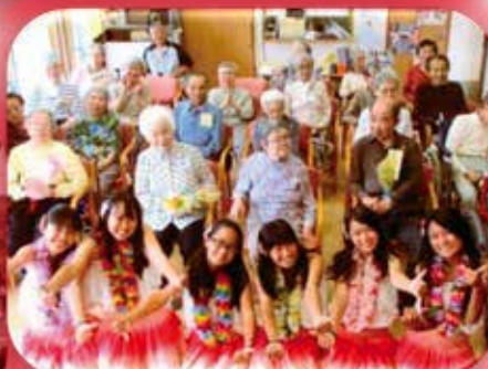
地域の老人福祉施設を訪問