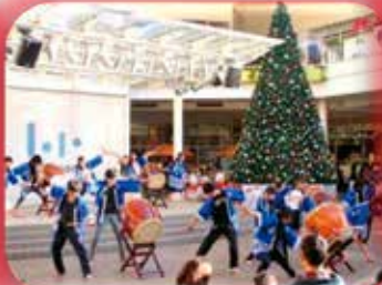
駅前公共スペースで発表