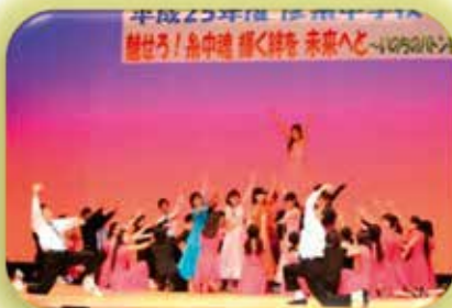
オペレッタ「希望の木」