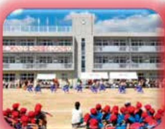
小学校運動会に参加