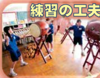
昼休みの自主練習