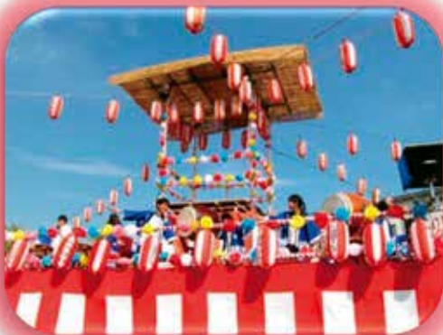
地域の祭りに参加