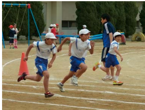
新体力テストの実施(50m走)