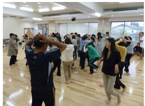
保育士・教員を対象とした運動遊び研修会