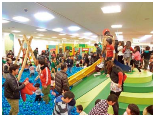
室内運動遊び場PEP KIDS KORIYAMA