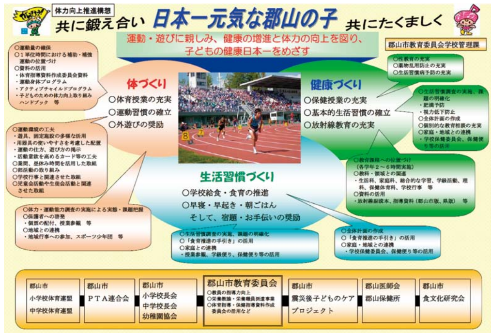
郡山市体力向上推進構想「日本一元気な郡山の子」