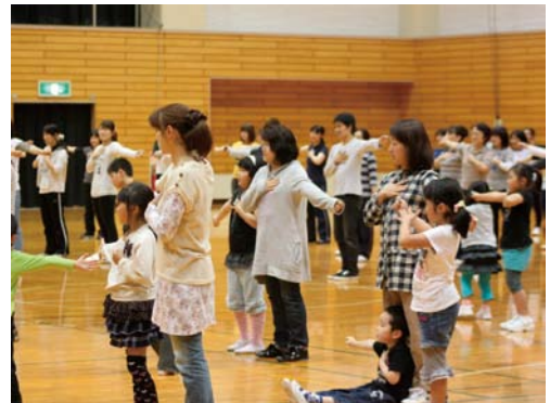
親子で運動遊び「元気を届ける体験活動」

さらに幼児期からの運動促進を目指して、運動遊びの具体例を示した「郡山市版幼児期運動実践プログラム」を策定するとともに、空き時間を使って小中学校の体育館を幼稚園・保育所に解放して、遊びの充実を図っている。また「元気を届ける体験活動事業」として、家庭で実施可能な親子での運動遊びを紹介している。