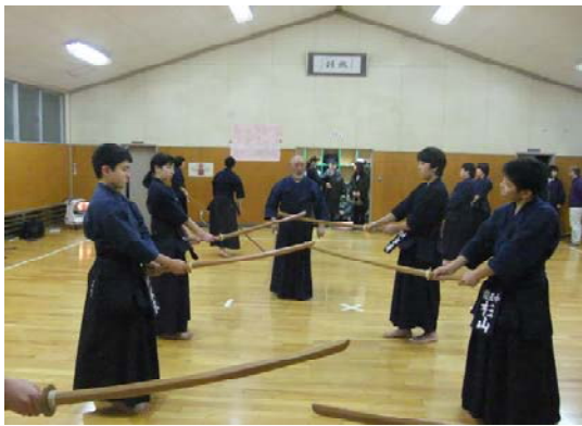
一足一刀の間合い