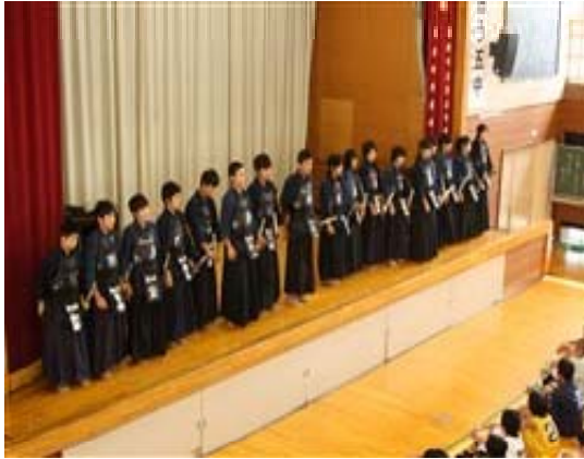
前橋市総体校内激励会