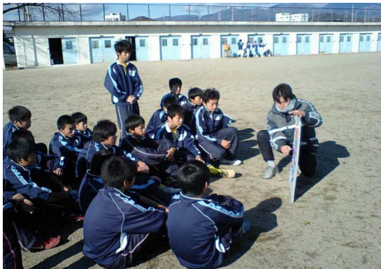
生徒の特徴に合った戦術の説明