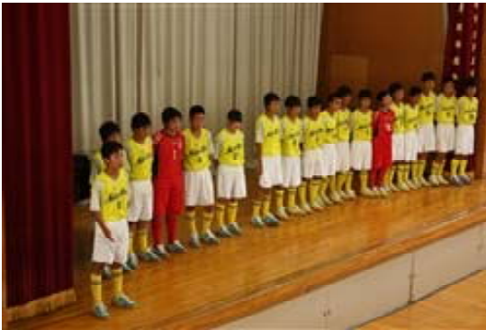
前橋市総体校内激励会

サッカーにおける基礎基本の定着を図ることやスポーツマン精神を育成したり試合時における戦術やコミュニケーションの取り方等、技術の向上を目指して5月から11月に渡り、計20回の指導を外部指導者に依頼した。