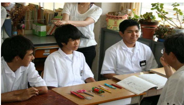
30人を超える外国人生徒への個別日本語指導

また、30 人を超える外国人の生徒が在籍しており、地域においてもブラジルや韓国をはじめ外国の文化に触れる機会が多く、学習展開の選択肢も幅が広がると考えた。