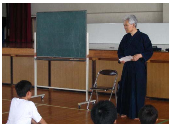
日本文化の再認識、すばらしい日本文化

1年の日本文化体験講座を中心とした、伝統的な日本文化への気づき、2年の異文化体験講座での外国文化への広がり、そして再び身近にある日本文化の再認識へと総合的な学習を展開した。