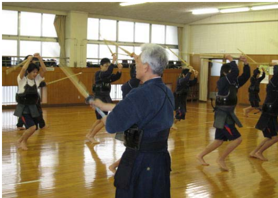
地域指導者と保健体育教員との素振りのTT指導