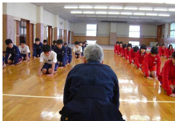
地域指導者の授業では常に、礼に始まる

地域指導者と事前に授業展開について、打合せをしており、保健体育教員とのTT指導をスムーズに進めることができた。普段の体育とは異なり、正座での礼に始まり、礼で終わる授業は、新鮮で緊張した時間となった。そして、一人一人の生徒によりそったきめ細かな実技指導が展開できた。