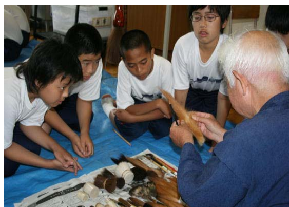
1年生の日本文化体験講座「豊橋筆づくり」

武道場では、空手の講座が開かれたが、空手道の考えや基本的な構え・動作を師範と弟子の方から学習した。また剣道の講座では、日本刀のつくり方や美術的な価値について、後半には体育館で剣道の実技を中心に学んだ。空手や剣道は当然知っていたが、直接体験している生徒は少なく、緊張した講座となった。