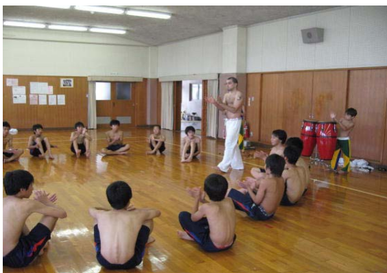
小さな講師も加わってのカポエラの講座

このように、異文化の理解を深めることが、身近にありながら、あまり意識してこなかった日本文化を見直す・再認識する活動になった。武道などの体育的な活動ばかりではなく、折り紙や藁草履作りなど、伝統的な手工芸に関する部分でも、優れた日本文化を再確認した生徒は多い。