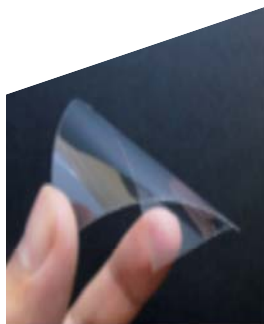
波長変換材を用いた フィルム