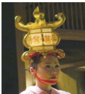
山鹿灯籠用 有機EL照明モジュール