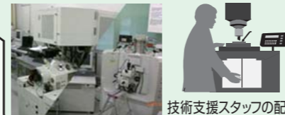
技術支援スタッフの配置