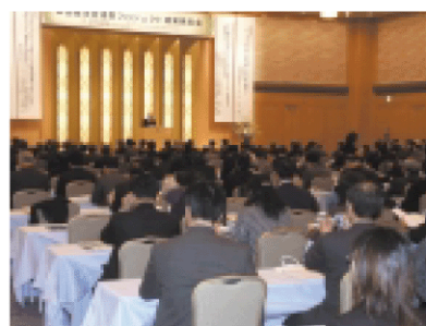
四国産学官連携プロジェクト成果発表会 (地域と両省が連携して推進する事業の成果を発表)

地域ごとに両省の事業の成果に関する合同成果発表会を年1回程度開催し、関係事業の参加者の間で情報交換を行っています。