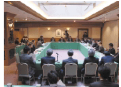
北海道ITクラスター推進協議会 (経済界、大学、自治体等と両省が事業の推進等について協議)

地域ごとに文部科学省、経済産業省、地方自治体その他関係機関による「地域クラスター推進協議会」を設置。知的クラスター創成事業及び産業クラスター計画の進捗状況報告や、具体的な連携策に関する情報交換等を実施し、両省事業の密接な連携と調整を図る場となっています。