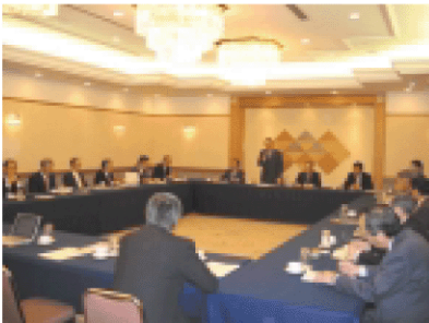
静岡県科学技術コーディネータネットワーク会議 (県内の産学官連携に携わるコーディネータが一堂に)

両省は、文部科学省の知的クラスター関連事業の補助対象機関と、経済産業省のプロジェクト推進組織等が、それぞれの地域において一体的に連携して活動するように支援しています。