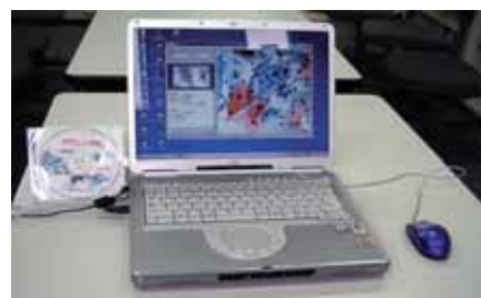
多焦点表示ソフト

欧米ではデジタル画像を病理研究に用いることが盛んになりつつあるが、日本では撮像に多大な時間を要することからあまり利用されていない。本研究開発では、広領域画像を高速でデータ化できるシステムを開発し光学顕微鏡に応用した。また、顕微鏡観察を完全にデジタルに置き換える試みとして、撮像データをあたかも顕微鏡を見ているかのように観察できるバーチャルマイクロスコープによる多焦点表示ソフトを開発した。