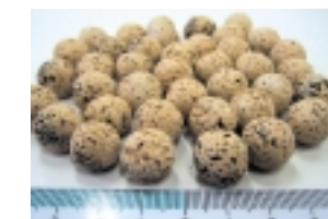
秋田スギ木炭とゼオライトを混合した濾材

この濾材による水質浄化性能を評価するため、生活雑排水が流入している八郎湖で筏方式による実証試験を行い、性能を検証して製品化を図る。