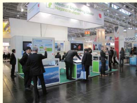
COMPAMED2012（ドイツ）での長野県ブース出展

信州大学等の豊富な素材技術シーズと長野県産業の強みである超精密技術を融合する「研究シーズ志向の産学官連携支援システム」に、病院等の医療現場ニーズに応えるメディカルモジュール・機器分野をターゲットとした「市場ニーズ志向の製品具現化促進システム」を追加して、産学官連携支援システムを発展させることにより、次世代産業の核となるスーパーモジュール供給拠点の形成を長野県全域で加速する。超高速PCR装置や蛍光磁性ビーズを用いた高感度臨床検査システム等のメディカル機器の研究開発・実用化をはじめとして、地域企業が保有する優れた技術の海外への売込みや海外の大学・研究機関等とのネットワーク構築等の国際的な展開を推進し、国際競争力のあるメディカル機器産業の集積地域を目指す。