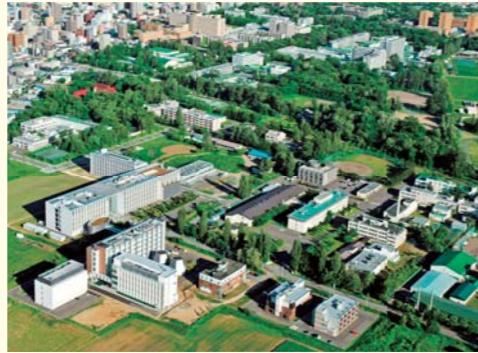
北大リサーチ&ビジネスパーク

ライフサイエンス研究を中心とした16の研究施設が集積する「北大リサーチ&ビジネスパーク」では、これまでの「食」に関する機能性分析・評価拠点の形成や道産食材の高付加価値化などによる健康科学産業の創出を目指す取組に加え、蓄積されてきた知識や技術を最大限に活かしながら、世界を先導する医療技術や医薬品の開発、「食」が有する生体機能性に着目した「健康科学と医療の融合」を図っていくイノベーション拠点の形成を目指す。さらに、最先端の医療技術を活用するメディカルツーリズムやフィットネスなど、人間の総合的な健康の維持・増進・回復を目指し、健康長寿社会形成に寄与する「ヘルスイノベーション」の展開を推進していく。