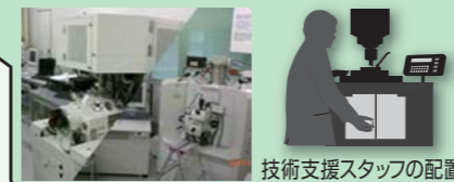
技術支援スタッフの配置