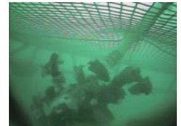
ユニット内での摂餌状況