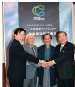
オール京都体制で臨む 京都環境ナノクラスター

ナノテクノロジーを核に、『省エネルギー、省資源』と成果の早期事業化をめざす「環境センシング」に集中特化した研究開発を行う。地域の中小・ベンチャー企業を中核に全国から有力企業の参画を得て、環境ナノ産業（ナノテクノロジーによる環境のための部材の高機能化とその部材の高度活用技術に支えられた産業）の集積化を図る。産業界主導による研究開発から商品化・販売までを見据えた「ニーズ志向」のトータルマネジメントで事業に臨み、成果展開を促進する。