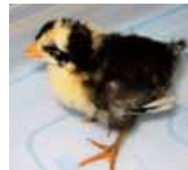
トランスジェニック・ニワトリ