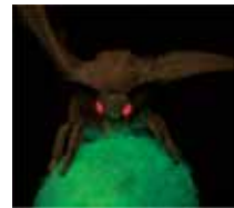
赤い目を持ち光る絹糸を吐き出すカイコ

事業期間中、地域独自の取り組みとして、新たな産学官連携組織の設置や県単独補助金の創設等、各種技術振興策を実施。