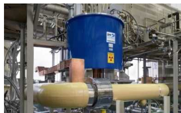
世界有数の強磁場研究施設

今後は、これまで個々に共同研究を行ってきた国内外の研究機関を繋ぎ、 複数機関の研究者群による国際チームが、理工共創型の多面的な研究を同時並行で行える環境を構築 する必要がある。