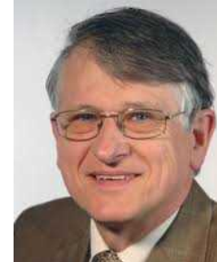
Dr. Klaus von KLITZING* (ドイツ)

マックスプランク研究所 部局長 ノーベル物理学賞(1985) 専門分野: 物理学