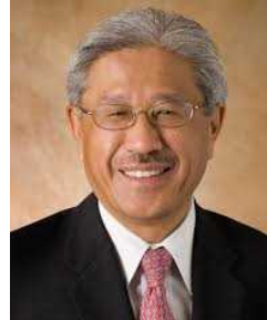
Dr. Victor DZAU* (米国)

メリーランド大学 教授 元米国国立科学財団(NSF) 長官 専門分野: 細菌学、遺伝学、海洋学