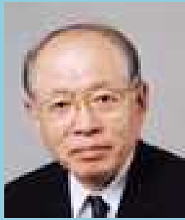
Dr. Ryoji NOYORI

公益財団法人水道技術研究センター理事長 前(独)国立環境研究所 理事長 元東京大学工学系研究科長・工学部長 専門分野: 環境工学