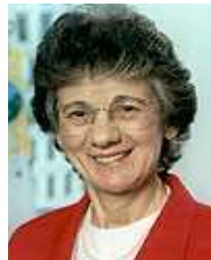
Prof. Rita R. COLWELL (米国)

メリーランド大学 教授 元米国国立科学財団(NSF) 長官 専門分野: 細菌学、遺伝学、海洋学